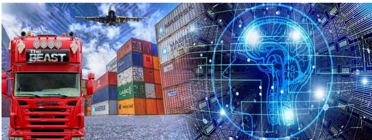
Рис. 4. Використання аналітики даних та штучного інтелекту

Аналітика даних та штучний інтелект (AI) використовуються у міжнародних перевезеннях вантажів для вирішення різних завдань та оптимізації логістичних процесів [5, 6] (рис. 4).