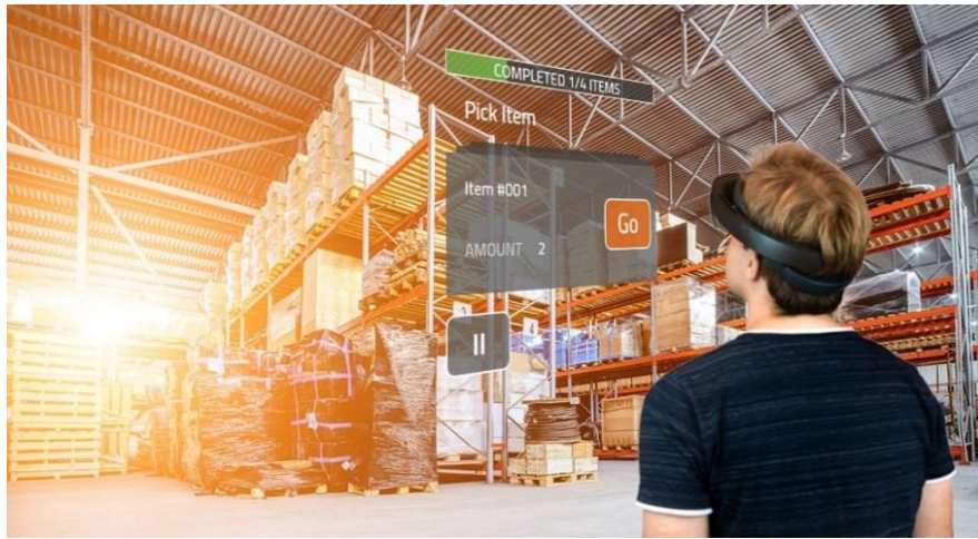
Рис. 5. Система «доповнена реальність» Augmented Reality (AR)

AR застосовується при організації міжнародних вантажних автоперевезень наступним чином: