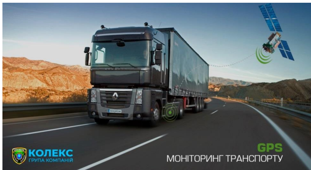
Рис. 3. Система глобального позиціонування

Система глобального позиціонування (Global Positioning System або GPS) широко використовується у міжнародних вантажних перевезеннях для управління, моніторингу та забезпечення безпеки транспортних засобів та вантажів [4] (рис. 3).