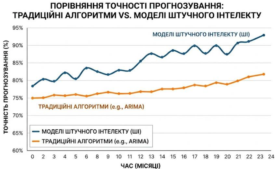
Рис.1 -Порівняння точності прогнозування традиційних алгоритмів та моделей штучного інтелекту

Комплексне впровадження технологій штучного інтелекту, машинного навчання та хмарних сервісів створює умови для підвищення продуктивності сучасних інформаційних систем, забезпечує швидке отримання аналітичних результатів та сприяє подальшому розвитку цифрових технологій.