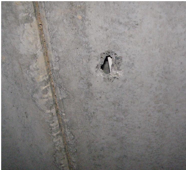
Рис. 3 – Надмірний прогин залізо-бетонної плити перекриття

Для уточнення величини прогинів виконано інструментальні вимірювання із застосуванням лазерного рівня (нівеліра) та вимірювальної рейки. Вимірювання проводились шляхом створення умовної горизонтальної базової площини за допомогою лазерного променя з подальшим визначенням відхилень поверхні плити у характерних точках прольоту (опори, третини прольоту, центр). За результатами вимірювань встановлено, що максимальні відхилення від горизонтальної площини зафіксовані в центральній зоні плити. Прогини визначались як різниця між відмітками опорних ділянок та середини прольоту.