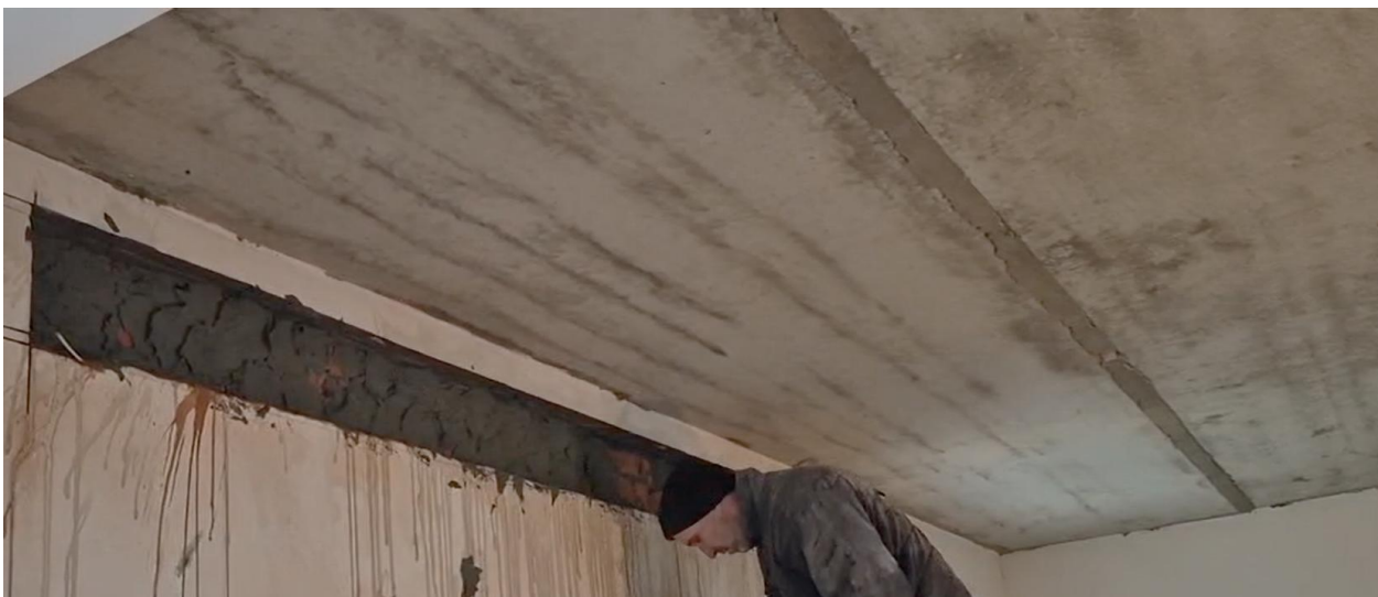
Рис. 1 – Залізобетонна перекриття будівлі з екструзійних багатопустотних плит

Дослідження стану перекриття проводилися на прикладі житлової будівлі, розташованої у приватному секторі міста Вінниці. Будівля безкаркасна, двоповерхова з підвалом, із зовнішнім та внутрішніми несучими стінами та залізобетонними перекриттями. Об'єктом дослідження є залізобетонне перекриття будівлі, виконане із багатопустотних попередньо напружених плит типу ПБ 63.12.8, виготовлених за екструзійною технологією (рис. 1).