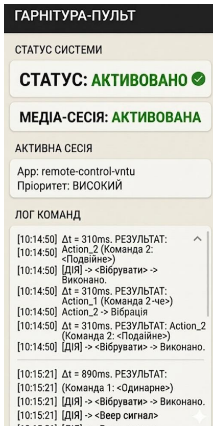
Рисунок 1 - Результат інтерфейсу програми після віддаленого управління при активній сесії