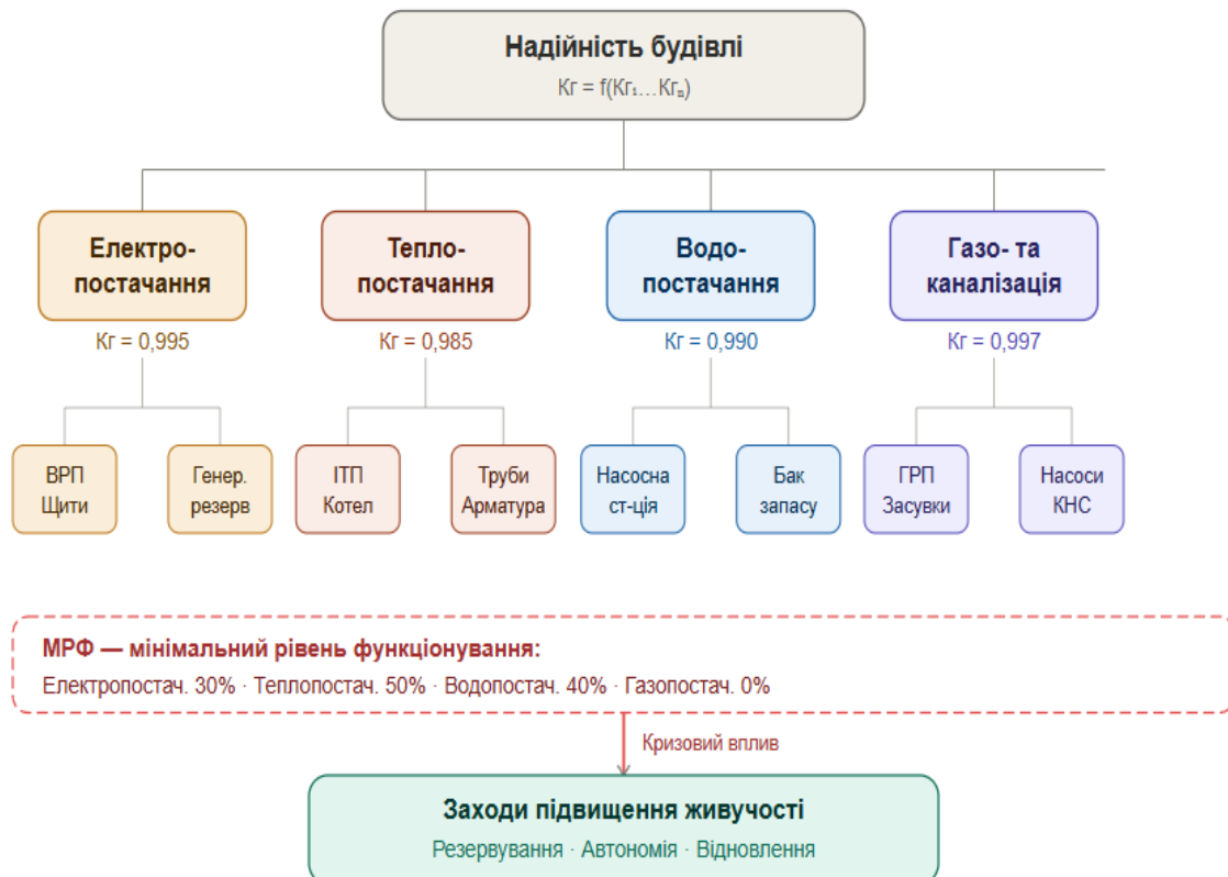
Рис. 1. Ієрархічна структура надійності інженерних систем цивільної будівлі та МРФ

На рис. 1 наведено ієрархічну структуру надійності інженерних систем цивільної будівлі, що відображає ієрархію підсистем від окремих вузлів до загального показника надійності об'єкта.