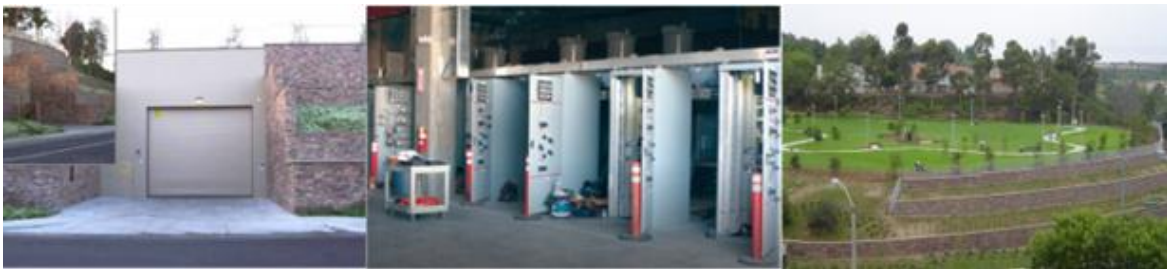
Рис.2 Підземна підстанція у місті Анахайм[1]

У багатьох розвинених країнах світу набирають популярності підземні підстанції. Звісно причина виникнення такого рішення в них відрізняється від нашої, але це не заважає розглядати таке рішення. Як приклад розглянемо підземну підстанцію у місті Анахайм, США (Рис. 2).