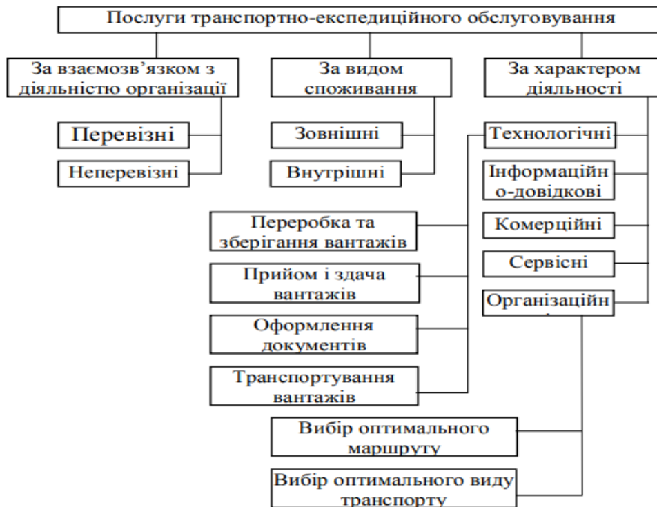
Рисунок 4 – Послуги транспортно-експедиторського обслуговування