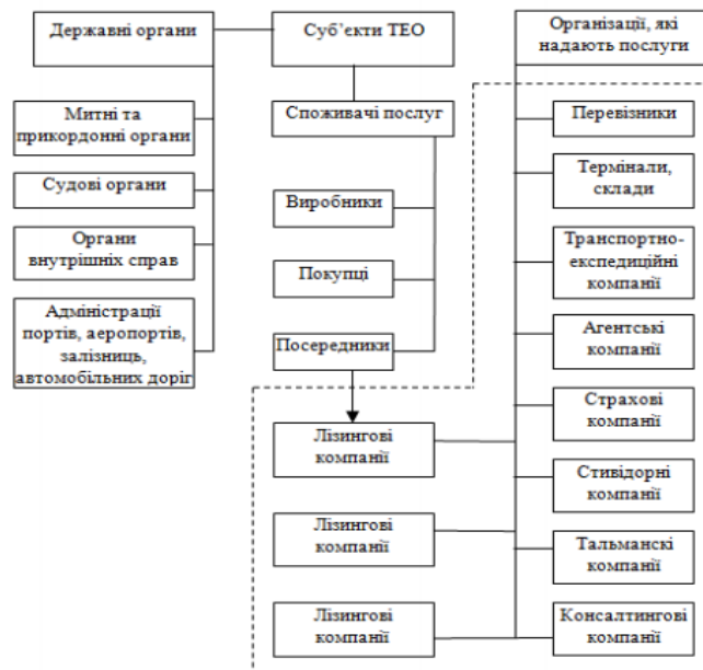
Рисунок 1 – Учасники транспортно-експедиторської діяльності

За видами обслуговування транспортно-експедиційні операції розділяють на чотири групи (рис. 2):