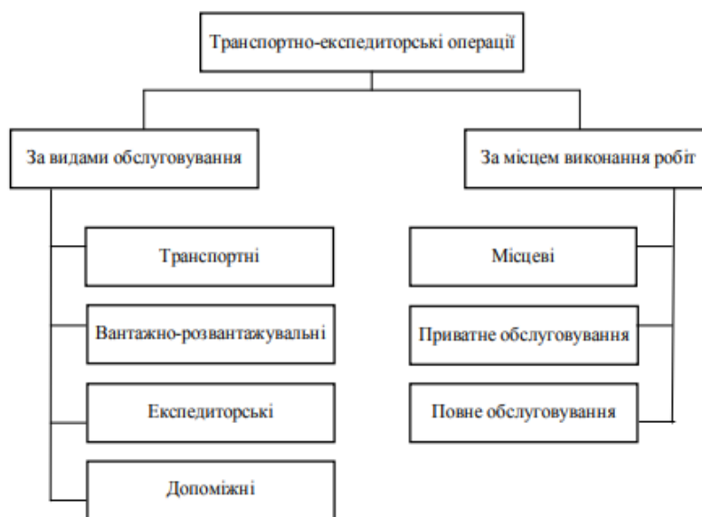
Рисунок 2 – Види транспортно-експедиторських операцій

За видами обслуговування транспортно-експедиційні операції розділяють на чотири групи (рис. 2):