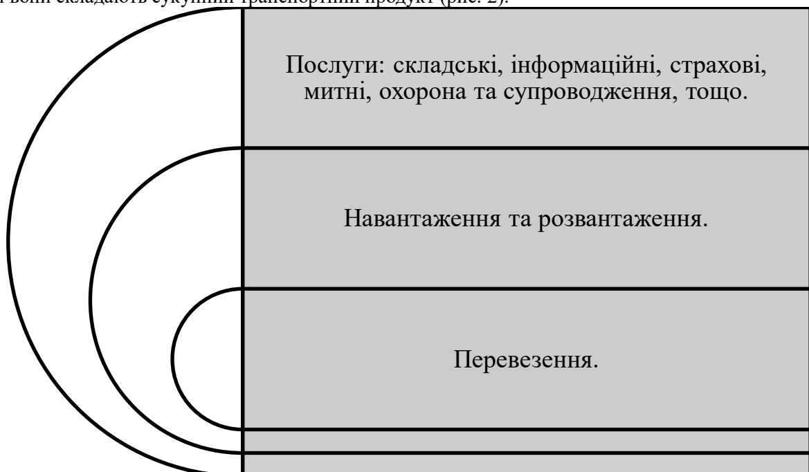
Рисунок 2 - Складові транспортного обслуговування

Досвід економічно розвинутих країн світу показує, що одним з важливих напрямів застосування маркетингу у сфері транспорту є комплексне транспортне обслуговування, яке за концепцією багаторівневості послуги включає власне переміщення в якості основної послуги, вантажні операції як допоміжні послуги та супутні послуги – інформаційні, складські, митні тощо. Разом вони складають сукупний транспортний продукт (рис. 2).