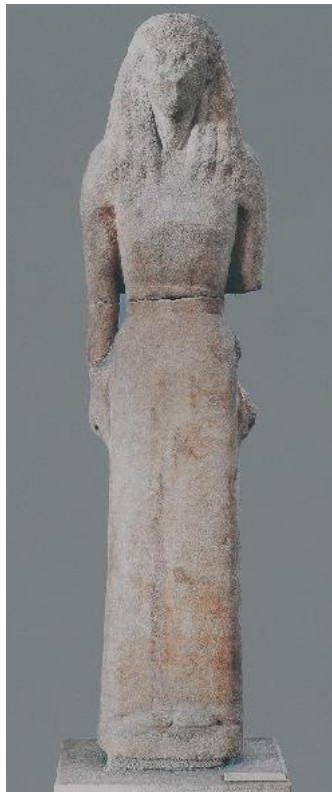
рис. 2 - «Кора, присвячена Делосу». Афіни, Національний музей.

Вже у VII ст. до н.е. були представлені вапнякові жіночі скульптури на Криті та Пелопоннесі, що називаються корами. Першою мармуровою скульптурою жінки вважається «Кора, присвячена Делосу». Ця статуя перевищує справжній зріст жінки того часу, одягнена у довгу сукню з тонким поясом на талії [2]. Зображення статуї подано нижче (рис. 2).