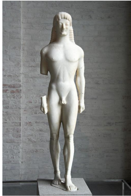
рис. 1 – «Аполлон Тенейський».

Вже у VII ст. до н.е. були представлені вапнякові жіночі скульптури на Криті та Пелопоннесі, що називаються корами. Першою мармуровою скульптурою жінки вважається «Кора, присвячена Делосу». Ця статуя перевищує справжній зріст жінки того часу, одягнена у довгу сукню з тонким поясом на талії [2]. Зображення статуї подано нижче (рис. 2).