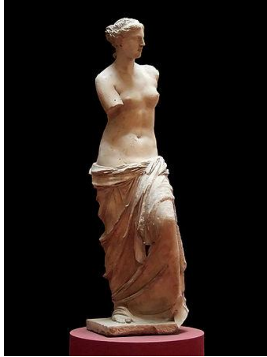
рис. 4 – «Венера Мілоська».

У 1820 р. на острові Мілос було знайдено мармурову статую Афродіти, яка носить назву Венера Мілоська. Статуя відтворює ідеал краси жіночого тіла того часу. Нині скульптура знаходиться у Луврі. Зображення статуї подано на рисунку нижче (рис 4).