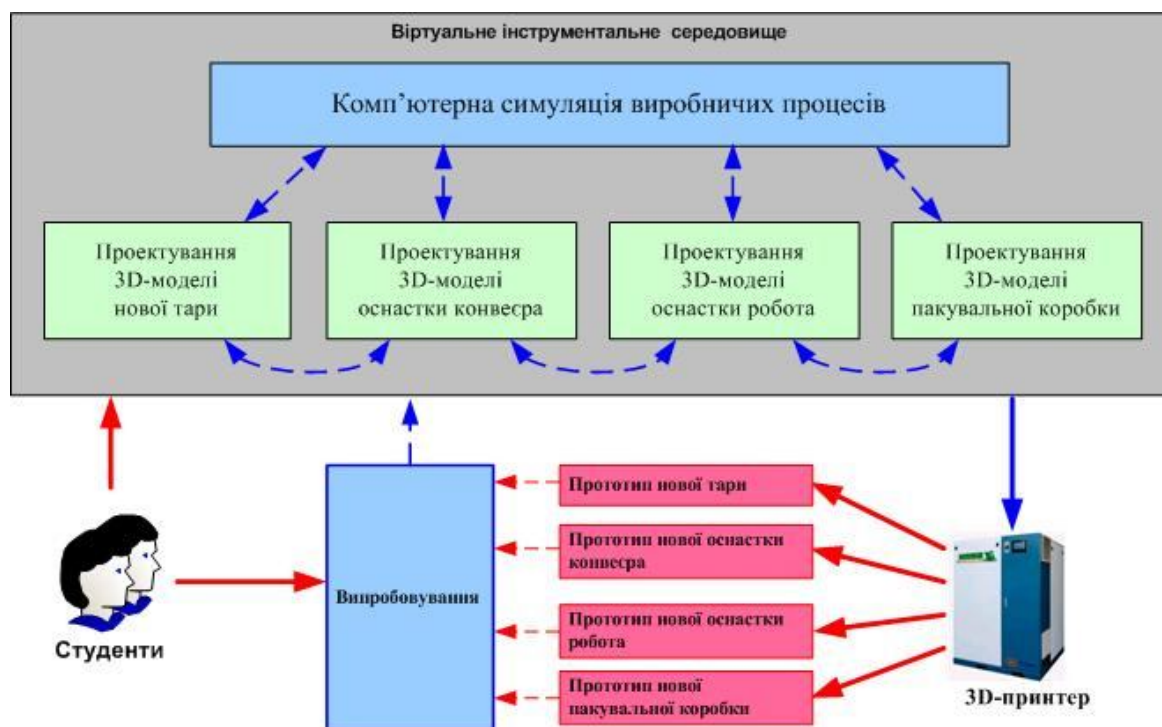
Рис. 2. Схема навчального процесу при виконанні практичних завдань цифрової трансформації

На рис.2 показана загальна схема навчального процесу при виконанні студентами усіх перелічених вище практичних завдань цифрової трансформації допоміжного виробництва.