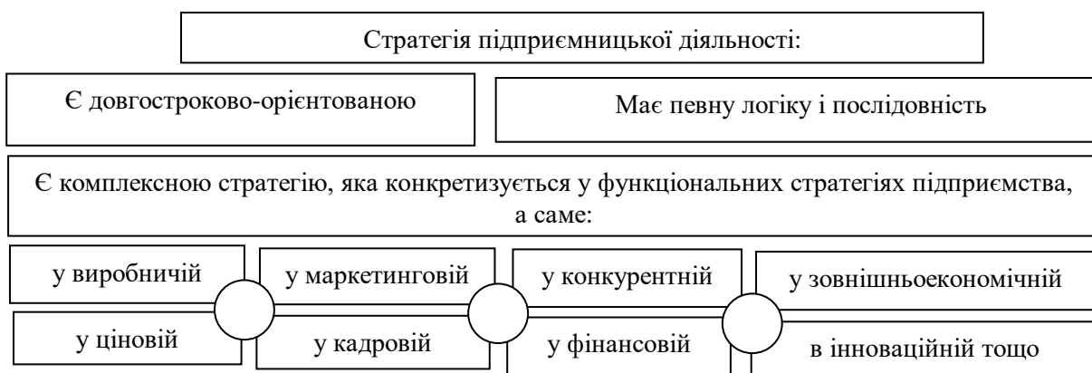
Рисунок 3 – Характерні риси підприємницької стратегії підприємства

(особливості). Проаналізувавши низку наукових праць [4], нами виокремлено характерні риси підприємницьких стратегій (див. рисунок 3).