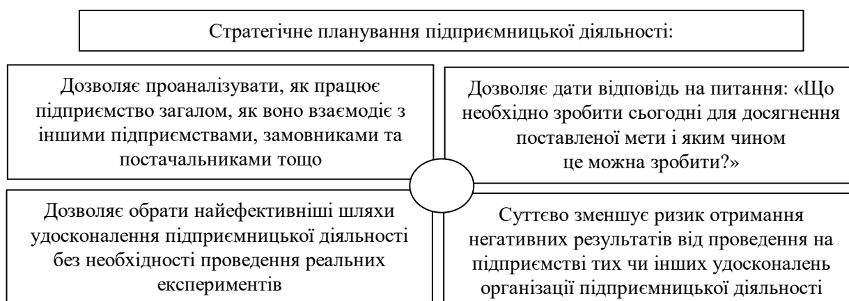
Рисунок 3 – Переваги стратегічного планування підприємницької діяльності

Одним із важливих напрямів підвищення рівня організації підприємницької діяльності на сучасних підприємствах є розробка та управління підприємницькою стратегією. Переваги стратегічного планування підприємницької діяльності описані багатьма дослідниками. На основі проведеного аналізу нами зроблено узагальнення переваг, що їх можуть отримати сучасні підприємства, які розробляють та реалізують стратегію своєї підприємницької діяльності. Результати зроблених нами узагальнень наведено на рис. 3.