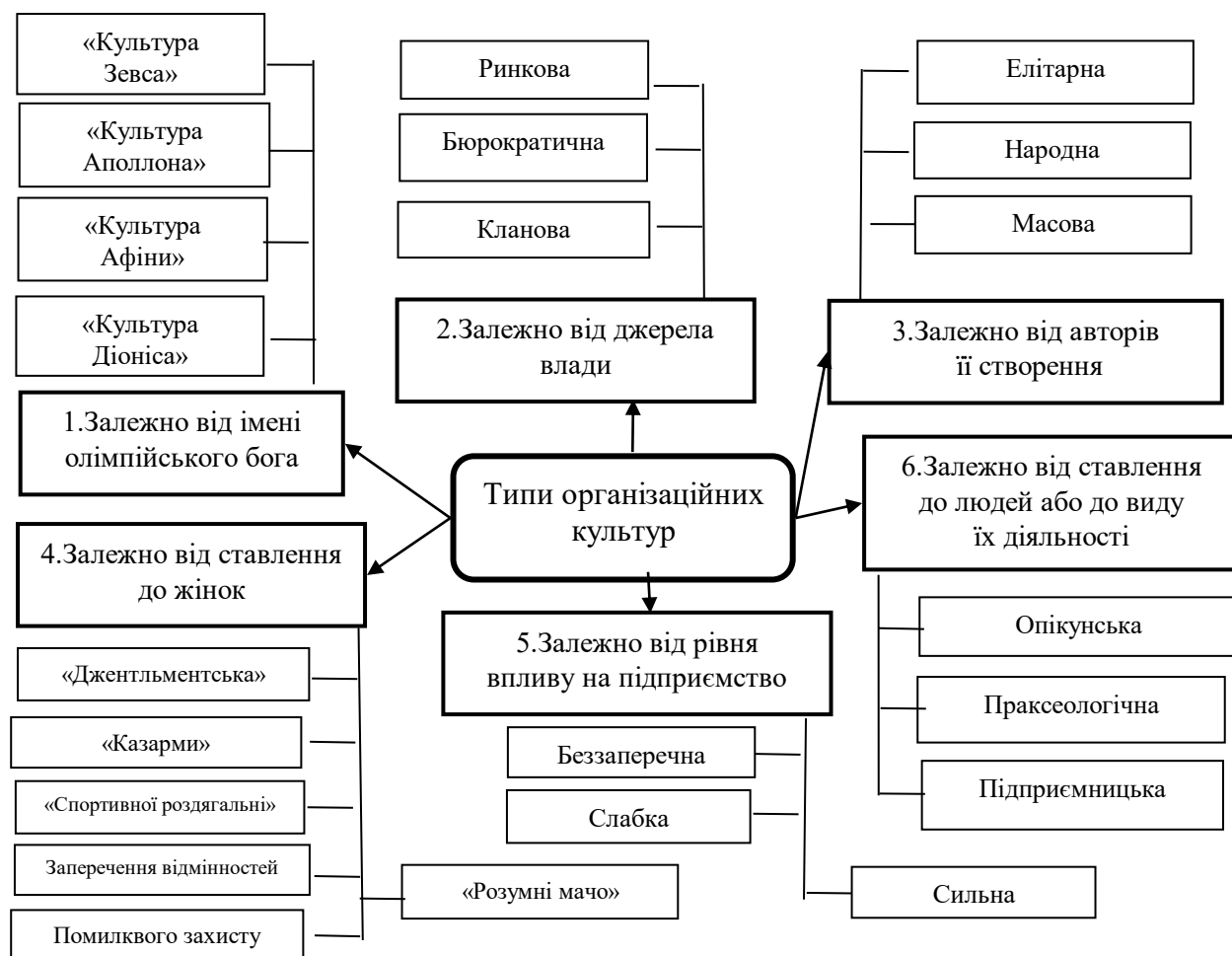
Рисунок 2 – Основні типи організаційної культури сучасного підприємства

Відомий дослідник організаційної культури Г. Хофштеде [3] визначив п'ять ознак, за якими можна ідентифікувати типи організаційної культури підприємства. Це: а) дистанція влади; б) індивідуалізм чи колективізм; в) ступінь сприйняття невизначеності та прагнення її уникнути; г) орієнтованість на майбутнє; д) рівень мужності, тобто акцентування на досягненні матеріального успіху.