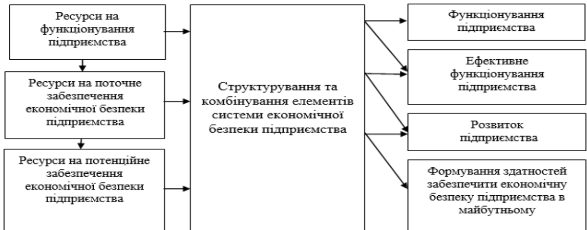
Рисунок 1. Структура системи економічної безпеки підприємства

Головні функції, які виконує служба економічної безпеки підприємства :