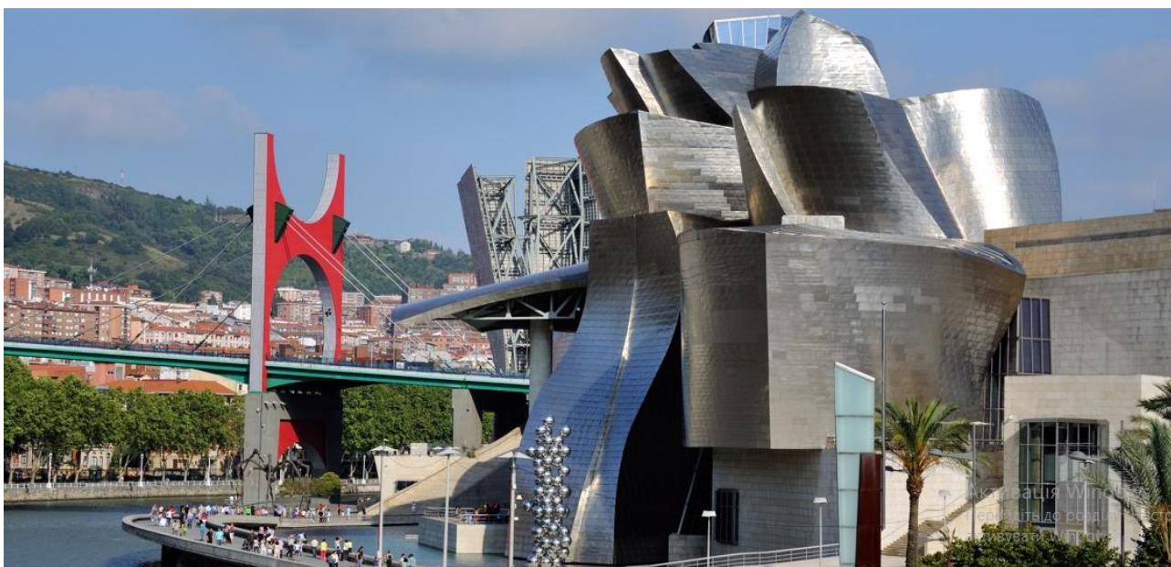
Рис. 5. Простір навколо музею сучасного мистецтва у м. Більбао

Простір навколо музею сучасного мистецтва у м. Більбао зображений на рис. 5. Більбао – місто на півночі Іспанії у Країні Басків, розташоване біля узбережжя Атлантичного океану. Завдяки вигідному розміщенню, Більбао був одним із центрів судноплавства. Однак у постіндустріальну епоху обсяги перевезення впали, а портова верф занепадала. У 1991 році музей Гуггенхайма в Нью-Йорку вирішив відкрити філіал в Європі. Уряд Країни Басків запропонував профінансувати будівництво музею в одному з міст регіону, натомість засновники музею брали на себе витрати з його обслуговування. Майданчиком для будівництва обрали саме закинуту верф у Більбао. На місці портових складів з'явилася деконструктивістська будівля авторства Френка Генрі та пішохідна зона з парком. Навколо музею встановили скульптури сучасних митців, а також стенди з історичними фотографіями верфі. Після відкриття музею у 1997 році кількість туристів у місті з кожним роком зростає, а явище, коли один простір задає розвиток всьому місту, назвали на честь міста «ефектом Більбао» [4].