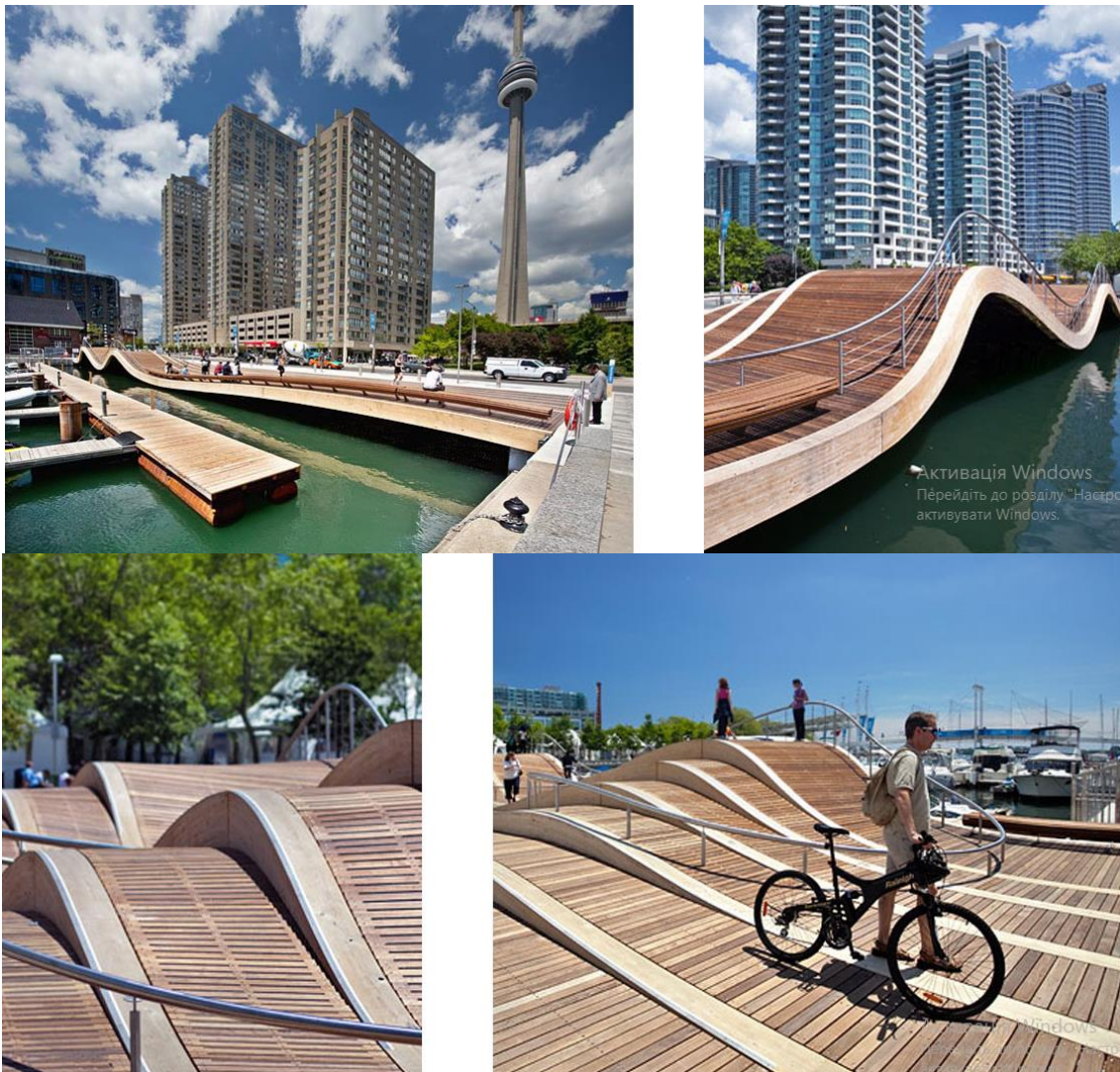
Рис. 4. Центральна набережна в м. Торонто

Проект Центральної набережної в Торонто (рис. 4) знаходиться в діловому центрі міста. До набуття сучасного вигляду набережна зазнала багато перебудов. У 60-х роках ХХ століття вздовж набережної проклали швидкісну трасу, а промисловість, яка розташовувалася на узбережжі, перемістилася за місто. Офісні центри, які почали з'являтися наприкінці століття, розбили її на багато непов'язаних одна з одною частин. Аби виправити це у 1999 році була створена громадська організація Waterfront Toronto, яка мала керувати ревіталізацією простору. Уряд Канади, провінції Онтаріо та муніципалітет міста Торонто зібрали на проект 1,5 мільярди доларів. У 2003 Waterfront Toronto представила план розвитку території, а у 2011 році закінчили облаштування центральної ділянки довжиною 3,5 кілометри.