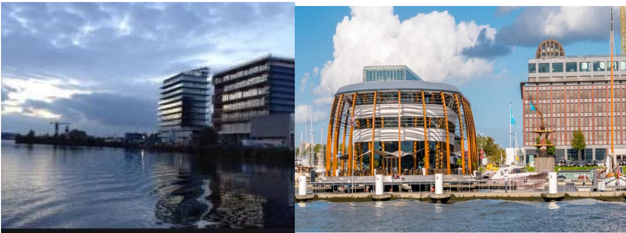
Рис. 1. NDSM в Амстердамі

На рис. 2 наведено проект «Місто біля фіорда» в Осло [2]. Це – амбітний проект місцевої адміністрації Осло, яка в 2000 році вирішила перетворити стару корабельню на живий район. Тепер тут можна купатись у басейнах, рибалити, гуляти пішки і їздити на велосипеді. Адже метою реновації було створення великого місця для відпочинку і прогулянок.