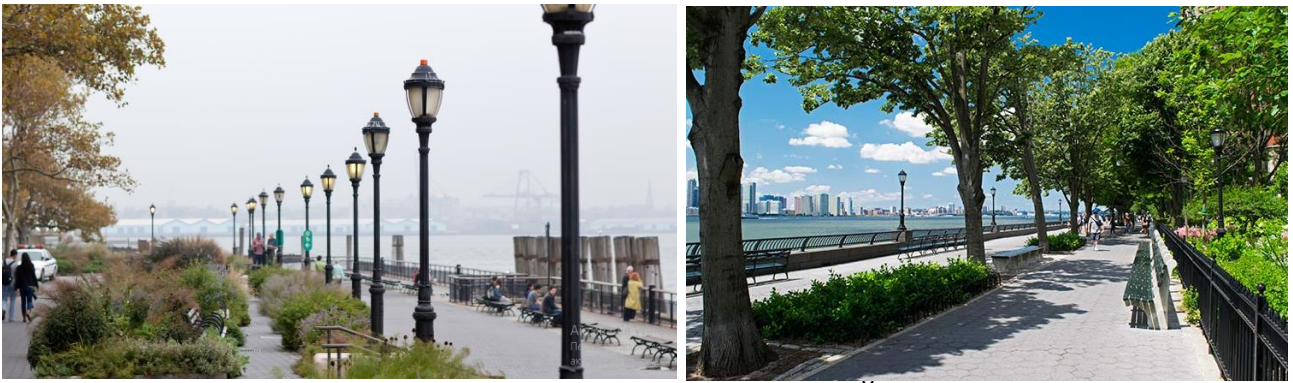
Рис. 3. Проект Беттері-Парк-Сіті, Нью-Йорк

Проект Центральної набережної в Торонто (рис. 4) знаходиться в діловому центрі міста. До набуття сучасного вигляду набережна зазнала багато перебудов. У 60-х роках ХХ століття вздовж набережної проклали швидкісну трасу, а промисловість, яка розташовувалася на узбережжі, перемістилася за місто. Офісні центри, які почали з'являтися наприкінці століття, розбили її на багато непов'язаних одна з одною частин. Аби виправити це у 1999 році була створена громадська організація Waterfront Toronto, яка мала керувати ревіталізацією простору. Уряд Канади, провінції Онтаріо та муніципалітет міста Торонто зібрали на проект 1,5 мільярди доларів. У 2003 Waterfront Toronto представила план розвитку території, а у 2011 році закінчили облаштування центральної ділянки довжиною 3,5 кілометри.