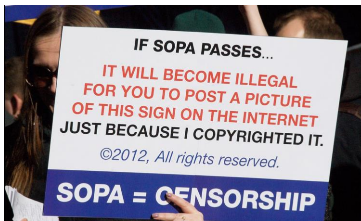
Рисунок 2 – Плакат учасників протесту

Законодавці зібрали більше 10 мільйонів імен, що контактували з ними для протесту проти законопроекту [5].