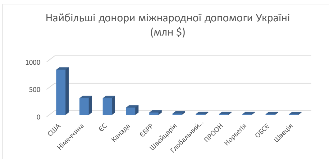
Рис. 1. Найбільші донори міжнародної допомоги Україні

Найбільші донори міжнародної допомоги Україні відображено на рисунку 1.