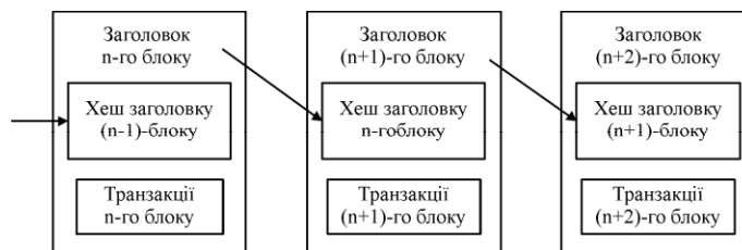
Рис. 1. Спрощена послідовність блоків

Blockchain – це розподілена структура даних, яка складається з послідовності блоків, в якій кожний блок містить хеш попереднього блоку, утворюючи, як наслідок, ланцюг блоків (рис. 1). Перший блок у ланцюжку (батьківський блок, genesis block) розглядають як окремий випадок, оскільки в нього відсутній попередній блок. Blockchain працює як розподілена база даних, яка здійснює облік усіх операцій у мережі. Операції мають відзначку часу і зберігаються у блоках, де кожен блок ідентифікується своїм криптографічним хешем. Blockchain повністю зберігається у кожному вузлі мережі. Для роботи Blockchain не потрібно довіри між вузлами мережі, оскільки будь-який вузол може самостійно перевірити, чи збігається його копія бази з копіями, які зберігаються в інших вузлах [14].