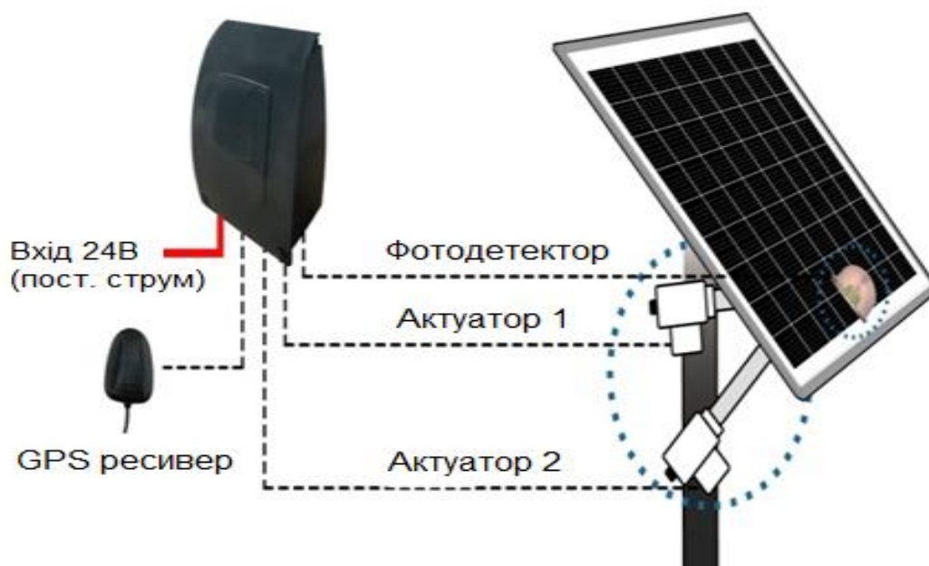
Рисунок 1 – Трекер на фотоелементах

Даний пристрій розроблено на основі фотодіодів. Протягом дня, освітленість діодів змінюється, за рахунок руху Сонця зі сходу на захід. Даний пристрій, моніторить освітленість фотодіодів, і відправляє керуючі сигнали на актуатор до того часу, поки освітленість всіх фотоелементів не буде однаковою. Актуатор, рухає панель зі сходу на захід, повторюючи денний цикл Сонця [2].