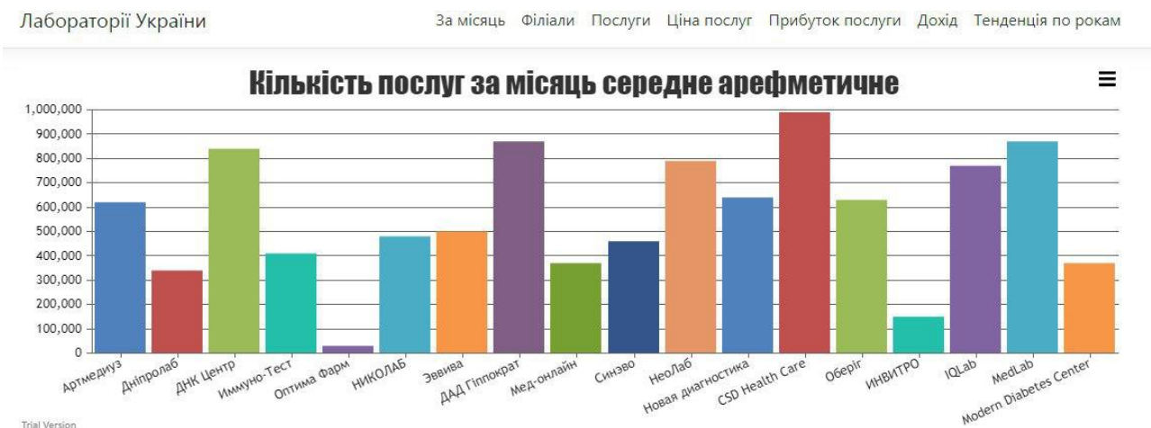
Рисунок 3 – Головна сторінка інформаційного ресурсу

З початкової сторінки, яка зображена на рисунку 3, відображається кількість наданих послуг лабораторіями за місяць (середнє арифметичне за рік).