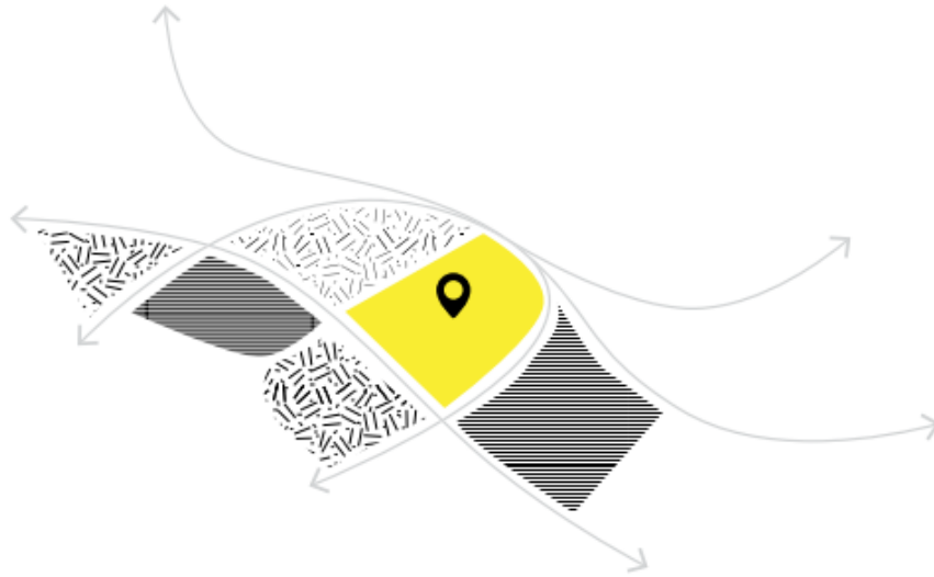
Рисунок 3-Площинні об'єкти (місця відпочинку, газони, клумби, майданчики)

Правильне поєднання різних типів елементів дозволяє досягти бажаних результатів, таких як концентрація уваги, комфорт і безпека. Ці результати повинні впливати з аналізу місцевих умов і користувачів. Різні типи об'єктів мають різні ефекти. З точки зору призначення: поверхневий об'єкт формує функціональне зонування області, а точковий об'єкт забезпечує чітку функцію на місці. Це можна застосовувати, знаючи кількість користувачів і характер їх взаємодії. Щоб об'єднати людей, можна використовувати точкові об'єкти (лаву, шаховий столик, амфітеатр). А коли варто розосередити відвідувачів, краще створювати площинні об'єкти, де кожен знайде комфортне місце (спортивні та дитячі майданчики). З іншого боку, лінійні об'єкти з'єднують точкові і площинні, забезпечуючи позитивний користувальницький досвід і прискорюючи пересування людей. Крім того, прямі шляхи дозволяють і стимулюють рухатись швидко, в той час як звивисті дають відчуття зручності [4].