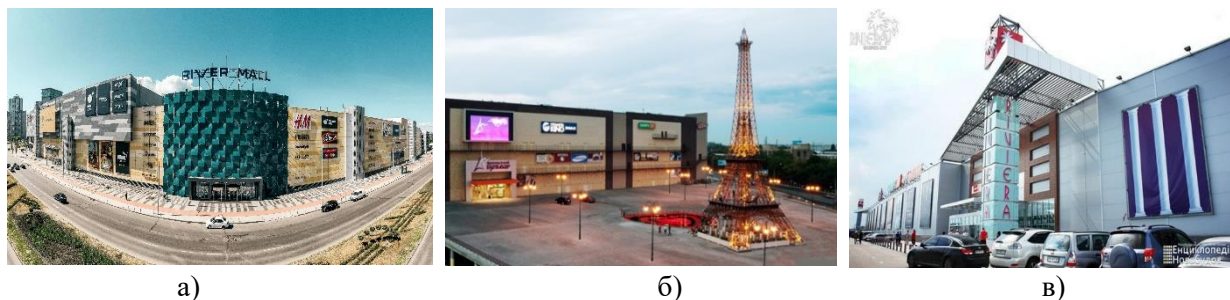
Рис.1. Приклади ТРЦ: а) - River Mall, б) - Французький бульвар, в) - Рів'єра

Торгово-розважальний комплекс «Рів'єра» (рис. 1в) - це найбільший в Україні центр торгівлі і розваг, що займає площу в 21 гектар, що нараховує більше 230 магазинів, гіпермаркетів, кінотеатр «Кіностар», спорткомплекс, боулінг-центр, розважальний комплекс для дітей, затишні кафе і ресторани. Розташований ТРЦ Рів'єра в на околиці міста Одеса біля селища Котовського. Зручний під'їзд, великий паркінг на 2500 місць, організовані регулярні автобуси в місто.