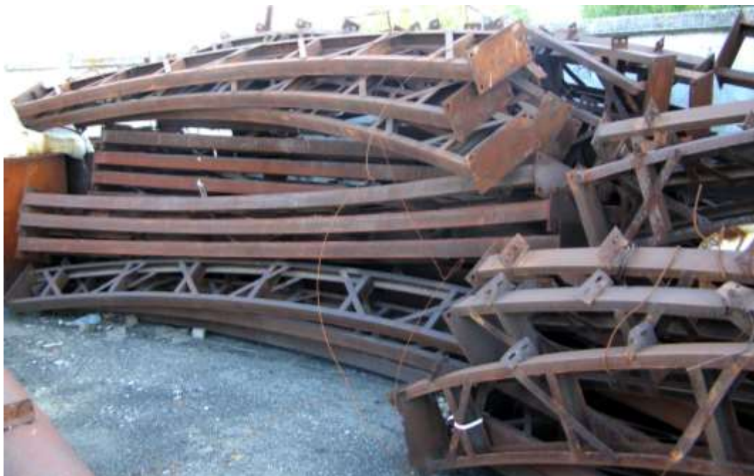
Рис. 2. Відправні елементи (секції) безшарнірних арок з розібраних складів сільськогосподарського призначення, що були у використанні.

Для розв'язання цієї задачі було проведено дослідження ринку металевих конструкцій, що були в ужитку. Виявлено, що значний сегмент цього ринку займають демонтовані елементи каркасів циліндричних сільськогосподарських складів у вигляді безшарнірних арок, виготовлених з металевих профілів (рис. 2).