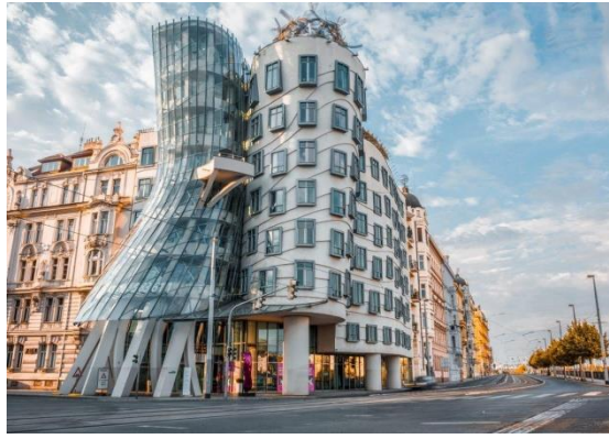
Рис. 2 - Офісна будівля «Nationale Nederlanden Building» («Танцюючий будинок»)

Як і багато споруд, побудованих у стилі деконструктивізм, дана будівля різко контрастує з сусіднім архітектурним комплексом рубежу XIX - XX століть. Автори проекту - хорватський архітектор Владо Мілуніч і канадський архітектор Френк Гері. Будівля являє собою офісний центр, в якому розташовуються декілька міжнародних компаній, галерея і готель. На даху знаходиться ресторан.[1]