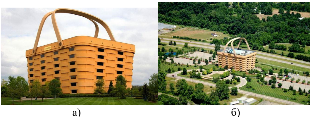
Рис. 4 - Офісна будівля компанії «Longaberger»

На відміну від інших будівель, даний офісний центр розширюється догори. Це дозволило значно збільшити робочий простір офісів: будова розрахована на штат в 500 співробітників. В будівлі передбачено семиповерховий атриум площею в 3300 м 2 , навколо якого і розташовані офіси