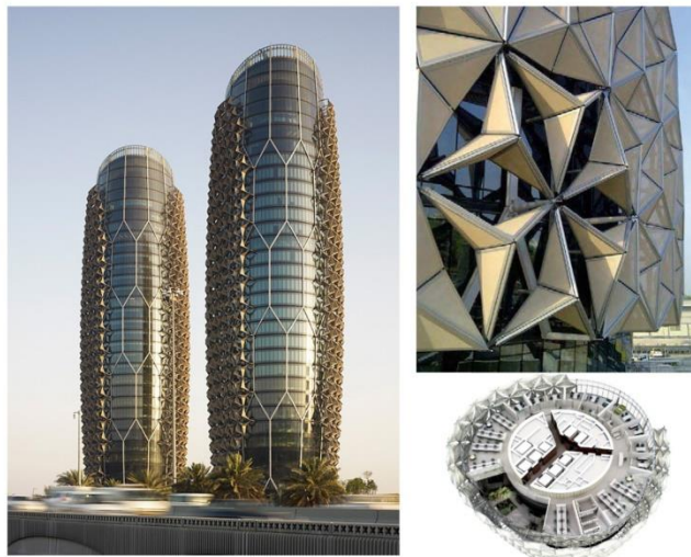
Рис. 3 - Офісний центр «Al Bahar»

Це парні вежі - хмарочоси, розташовані в АбуДабі (ОАЕ). На даний момент в баштах «Аль Бахар» розміщується штаб - квартира Інвестиційної Ради Абу Дабі (ADIC). Загальна офісна площа будівель становить 70 000 квадратних метрів. Будинки розраховані на 1000 співробітників. Архітектура веж Аль - Бахар є поєднанням нових будівельних технологій і традиційного арабського архітектурного стилю «Машраб», особливістю якого є часті решітки на вікнах зі складним візерунком.(Див. рис. 3)