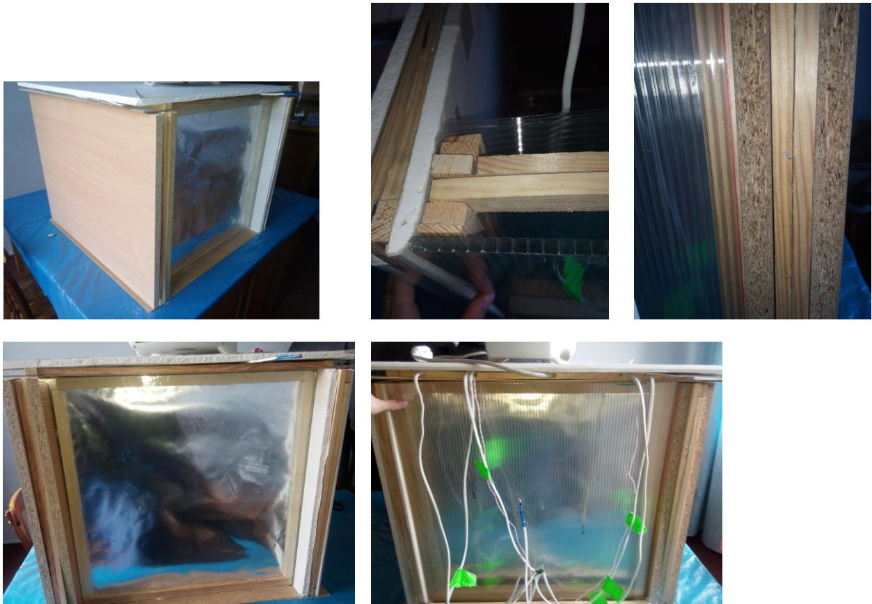
Рисунок 1 – Фотофіксації експериментальної установки

Експериментальна установка зображена на рисунку 1, а її схема на рисунку 2.