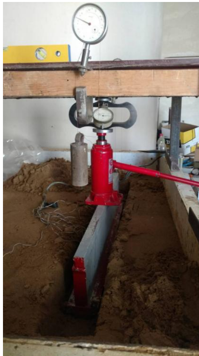
Рисунок 1 – Модель фундаменту в процесі випробування

Для передачі і вимірювання навантаження використовувалися відповідно автомобільний домкрат і динамометр, які розраховані на максимальне навантаження 5 т. В якості опорної системи для домкрата було використано металеву раму. На рис. 1 показана модель фундаменту в зборі.