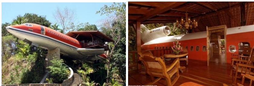
Рис. 7. Costa Verde, Коста-Ріка

Готель Costa Verde (рис.7), Коста-Ріка. Яскраве мислення і нестандартний підхід повернули до життя старий іржавий Боїнг 727, а разом з цим принесли всесвітню популярність готелю Costa Verde. Дивлячись здалеку, можна подумати, що літак зазнав аварії в джунглях, але варто підійти ближче - вашим очам відкриється вся краса і неординарність люксового номера готелю.