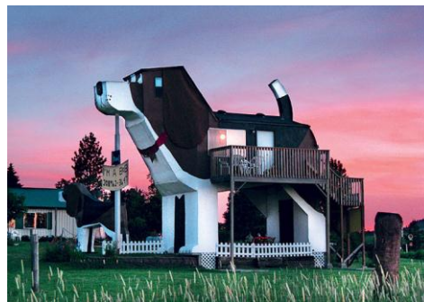
Рис. 4. Dog Bark Park Inn, Айдахо, США

Dog Bark Park Inn - готель у вигляді собаки (рис.4), Айдахо, США. 10-метрову собаку породи бігль з фанери і гіпсокартону збудувала сімейна пара художників, різьбярів по дереву. Кімнати розташовані в її животі. Для прикраси інтер'єру використовуються зображення собак.