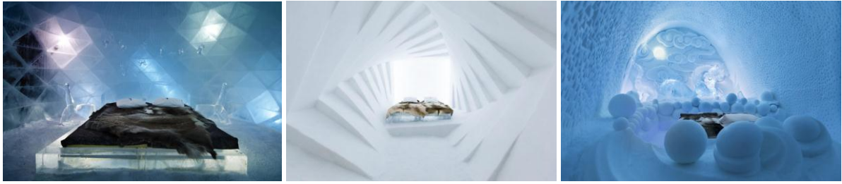
Рис. 2. Льодовий готель, Швеція

Готель на дереві Мансанільо (рис.3), Коста-Ріка, точніше сказати одна підвісна платформ 60 м 2 розташована на висоті 25 м. При зведенні не було використано жодного гвинтика чи цвяха. Вода в душову кабінку надходить з атмосферних опадів, а електроенергією житло забезпечують сонячні батареї. Крім сантехнічних зручностей, на першому поверсі розташовані дивани і гамаки для насолоди видами Карибського басейну, а на другому (захищеному москітною сіткою) - два двомісних ліжка. Тут прокидаються від ранкового концерту мавп-ревунів, а засинають під заколискуючу балаканину папуг.