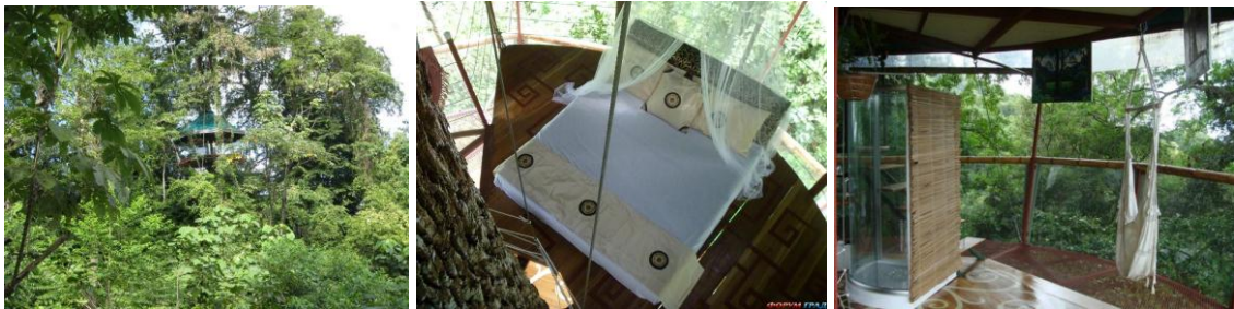
Рис. 3. Nature Observatorio, Коста-Ріка

Готель на дереві Мансанільо (рис.3), Коста-Ріка, точніше сказати одна підвісна платформ 60 м 2 розташована на висоті 25 м. При зведенні не було використано жодного гвинтика чи цвяха. Вода в душову кабінку надходить з атмосферних опадів, а електроенергією житло забезпечують сонячні батареї. Крім сантехнічних зручностей, на першому поверсі розташовані дивани і гамаки для насолоди видами Карибського басейну, а на другому (захищеному москітною сіткою) - два двомісних ліжка. Тут прокидаються від ранкового концерту мавп-ревунів, а засинають під заколискуючу балаканину папуг.