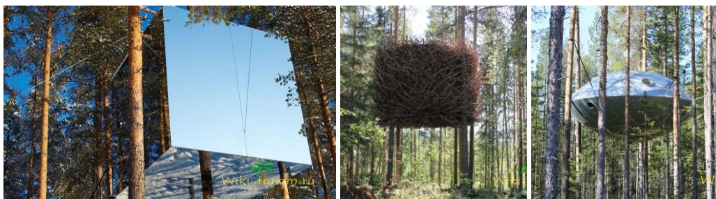
Рис. 6. Treehotel, Швеція

Готель на дереві Treehotel (рис.6), Швеція. У готелі є дивовижні апартаменти: у вигляді НЛО, пташиного гнізда або бабки, дзеркального куба.