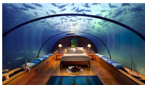
Рис. 1. Підводний готель Джулс, США

Льодовий готель (рис.2) в Швеції, який щороку будується «з нуля», тому що на самому початку весни вся композиція просто тоне під сонцем. На початку листопада готель зводиться заново з використанням понад 1000 тонн льоду.