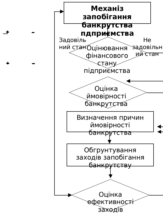
Рис. 1 – Механізм запобігання банкрутства

Існують такі моделі, як: Е. Альтмана, Р. Ліса, Р. Таффлера, Г. Спрінгейта, О. Терещенка, В. Матвійчук, які прогнозують банкрутство підприємств за фінансовими показниками [3].