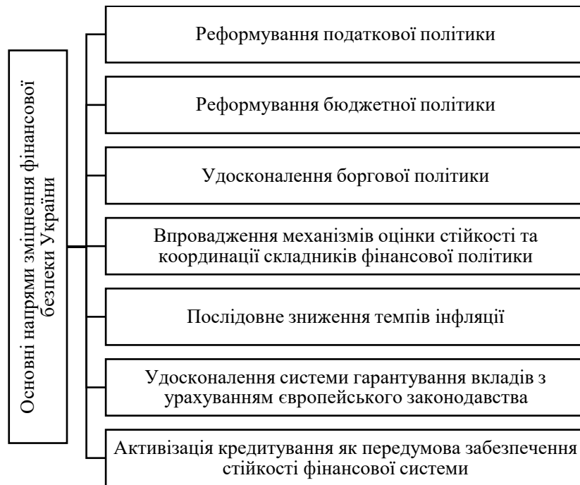
Рис. 3. Напрями зміцнення фінансової безпеки України в сучасних умовах