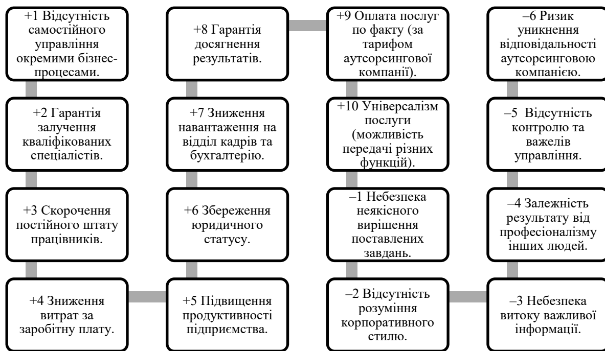
Рис. 2. Переваги та недоліки аутсорсингу (розроблено автором з використанням [3])

Переваги, що досягаються від співпраці з аутсорсинговими підприємствами та неминучі недоліки, що виникають від співпраці з аутсорсинговими підприємствами, наведені на рис. 2.