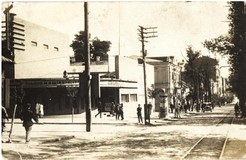
Рис.2 – Фото кінотеатру ім. М. Коцюбинського, 1933 рік [4]

Історичні кінотеатри, як символи культурного спадку та архітектурної майстерності, зазнають серйозних загроз знищення в сучасному світі. Загроза не тільки втрати унікального спадку, а й втрати важливого елементу соціокультурної та міської ідентичності. З поступовим зниженням відвідуваності кіносеансів просторі приміщення кінотеатру ім. М. Коцюбинського, які від початку були спроектовані для прийому великої кількості людей, у 1995 році стали осередком дійства для вінницького Експоцентру, приводячи до швидкого відновлення культурно-освітніх зв'язків [4].