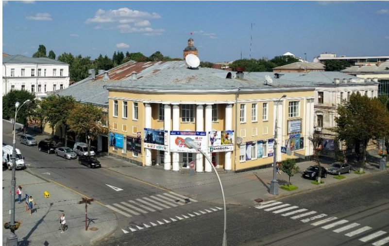
Рис.3 – Фото кінотеатру Коцюбинського перед закриттям

Прикладом вдалої реконструкції історичного кінотеатру є досвід відновлення кінотеатру «Жовтень» (первісна назва «Дев'яте Держкіно»), м. Київ, що довгий час був під загрозою знищення та постраждав від підпалу (жовтень 2014). При реконструкції були зняті нашарування попередніх років в оздобленні та відтворене загальне композиційне вирішення будівлі [5].