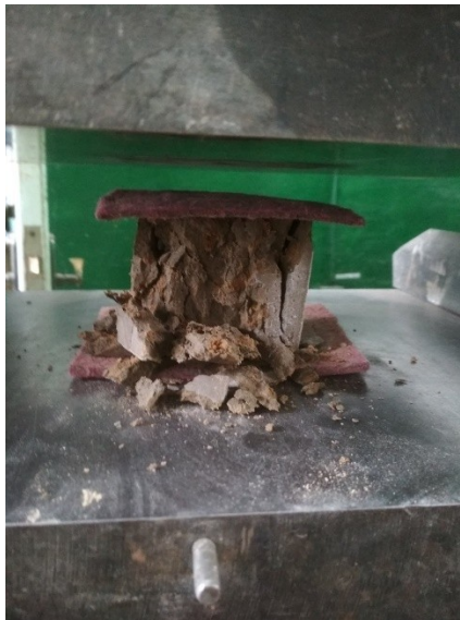
Рис. 2 – Зразок ґрунтоцементу після руйнування на пресі