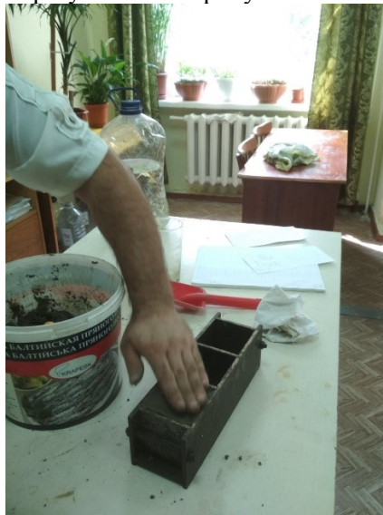
Рис. 1 – Процес укладання ґрунтоцементної суміші у форми

У таблиці 2 та на рис. 4 наведені результати випробувань.