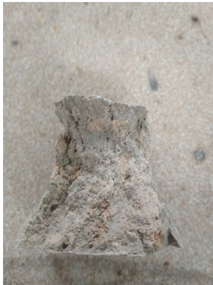
Рис. 3 – Структура ґрунтоцементу