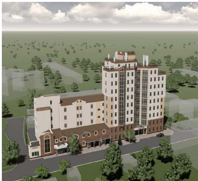
Рис. 4- Вигляд готелю «Добродій» після реконструкції