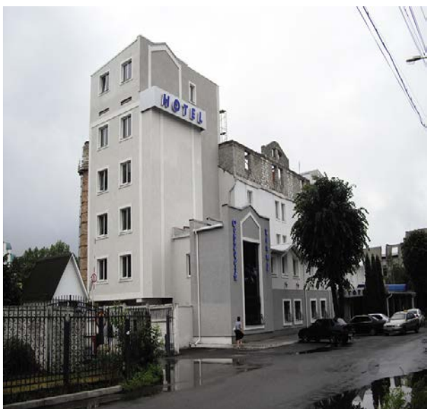
Рис. 3- Стан готелю «Добродій» до реконструкції

Практичним використанням усіх теоретичних викладень у цій статті можна показати на прикладі готелю «Добродій». На рис. 3 показано стан до реконструкції, а на рис. 4 показано вигляд який буде після реконструкції. Було використано один з варіантів просторового розширення в якому добудовується частина готелю, але вона є продовженням основної будівлі, а також були запропоновані у якості міжкімнатних перегородок гіпсокартонну конструкцію, із застосуванням вертикального профілю у 75-100 мм, з сертифікованими звукоізоляційними плитами всередині.