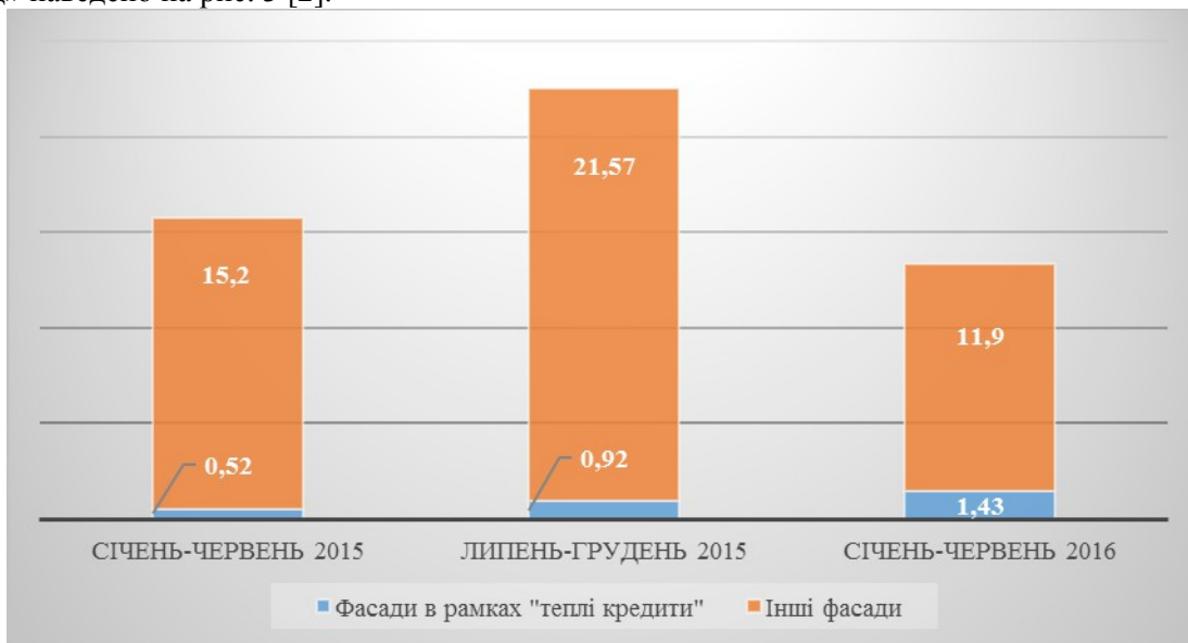
Рис. 3. Вплив програми «теплі кредити» на споживання ТІМ в сегменті фасади «мокрый метод», млн. м 2 (за даними www.AIMarketing.info )

Відомо, що в Україні з жовтня 2014 року діє урядова програма по компенсації витрат на придбання енергозберігаючого обладнання для населення, ОСББ та ЖБК - так звана програма «теплі кредити». Вплив програми «теплі кредити» на споживання ТІМ в сегменті фасади «мокрый метод» наведено на рис. 3 [2].