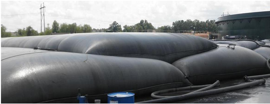
Рис. 5. Зневоднення та зберігання річкового мулу у геотубах.

Зневоднений в геотубах річковий мул (донні відкладення) можуть зберігатися в цих же геотубах необмежений час, при цьому зневоднені речовини не зволожуватимуться і невимиватимуться із внутрішнього об'єму геотуба атмосферними опадами, паводками та іншими явищами.