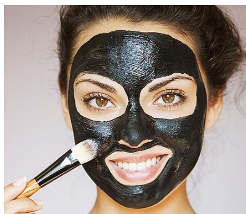
б) Омолоджуюча ліфтинг-маска для обличчя