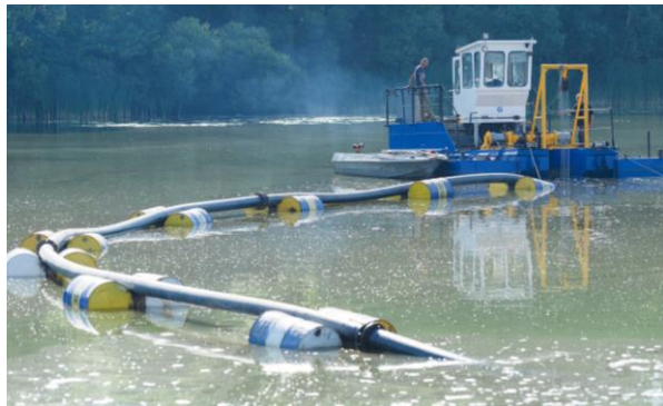
Рис. 2. Робота земснаряда в акваторії Сабаріського водосховища

Зокрема, 20 тис. кубометрів видобутого річкового мулу при вологості 96,4% можна розмістити у двох геотубах шириною 16 м, довжиною 60 м, або в шести геотубах шириною 16 м, довжиною 20 м, покладених один на одного, при цьому вологість складе не більше 70%. Площадка із геотубами займе площу близько 2000 м 2 , тобто 0,2 га. При цьому процес зневоднення видобутого річкового мулу у геотубах займає кілька тижнів, тоді як на традиційних мулових майданчиках аналогічні процеси протікають роками. В разі використання флокулянта, річковий мул з початковим вмістом води 96,4%, зневоднюється в геотубі до вмісту води 69,4% за 17 годин.