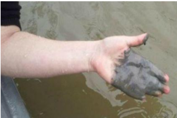
Рис. 1. Донні відкладення (мул) Південного Бугу

Пропонується складувати річковий мул (донні відкладення) у геотуби на невеликих площадках, зберігаючи прибережні дерева, кущі верболозу та зарості очерету (рис. 4, рис. 5).