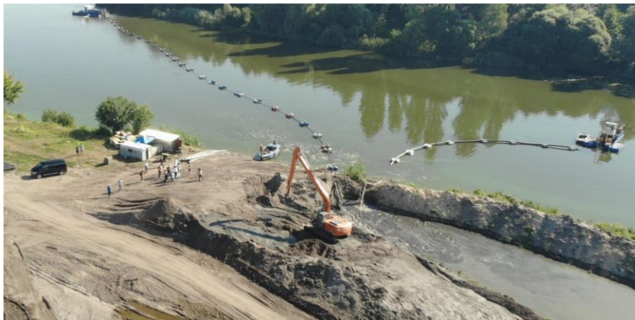
Рис. 3. Берегова карта наміву донних відкладень Південного Бугу.

Зокрема, 20 тис. кубометрів видобутого річкового мулу при вологості 96,4% можна розмістити у двох геотубах шириною 16 м, довжиною 60 м, або в шести геотубах шириною 16 м, довжиною 20 м, покладених один на одного, при цьому вологість складе не більше 70%. Площадка із геотубами займе площу близько 2000 м 2 , тобто 0,2 га. При цьому процес зневоднення видобутого річкового мулу у геотубах займає кілька тижнів, тоді як на традиційних мулових майданчиках аналогічні процеси протікають роками. В разі використання флокулянта, річковий мул з початковим вмістом води 96,4%, зневоднюється в геотубі до вмісту води 69,4% за 17 годин.