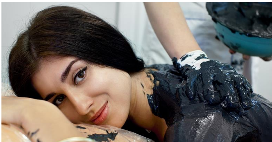
а) Антицелюлітна корекції фігури

Важливим є те, що цілюща дія сапропелі проявляється не тільки в місці контакту із шкірою, а й на організм в цілому. При цьому методики легко здійснимі (як зовнішньо, так і перорального та ентерального застосування), та набагато кращі для індивідуального застосування в домашніх умовах.