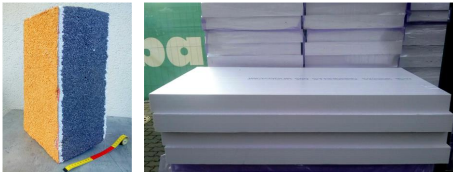
Рис.1. Пінопластові утеплювачі фасадних стін: ліворуч – з екструдованого полістиролу; праворуч – у вигляді конструктивних елементів товщиною 160 мм з уступами висотою 80 мм по периметру

Решта теоретичного потенціалу (3,8 %) пов'язана з протягами. Для його практичної реалізації рекомендовано використовувати відомі технологічні рішення [12].