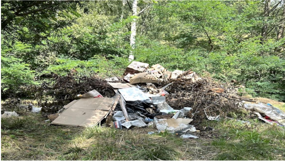
Рис.2. Стихійне сміттєзвалище поблизу сувенірного ринку в Яремчі, серпень 2024 року

Як бачимо, недостатня кількість сміттєвих баків, нерегулярне вивезення сміття, а також низька екологічна культура туристів сприяють утворенню таких забруднень. Особливо небезпечною ситуація стає в контексті впливу на водні ресурси: сміття, потрапляючи у водні артерії, завдає шкоди природним екосистемам. Таким чином, туристична діяльність без належного екологічного контролю стає серйозним джерелом загроз для довкілля Яремчі та прилеглих територій, що вимагає негайних заходів щодо покращення ситуації.