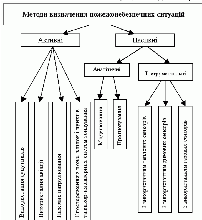
Рисунок 1 – Основні методи визначення пожежонебезпечних ситуацій

Основні методи визначення пожежонебезпечних ситуацій наведено на рис. 1.