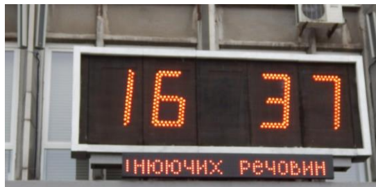
Рисунок 2 - Табло на будівлі Вінницької міської ради

Табло на будівлі Вінницької міської ради, у вигляді рухомого рядка, транслює інформацію про стан забруднення повітря та радіаційний фон у Вінниці (рисунок 2). Так, у повідомленні йдеться, що Вінниця за рівнем забрудненості – на 37-му місці і вважається одним із найчистіших міст в Україні [3].