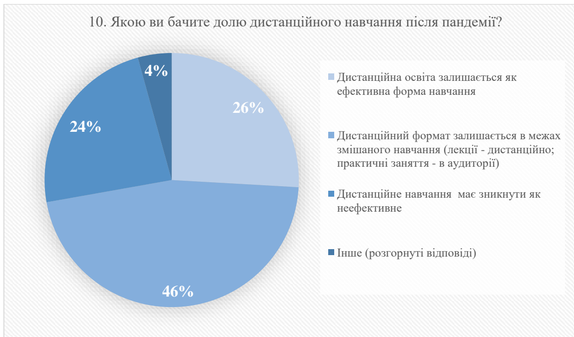
Рисунок 2 – Продовження 1

Як бачимо, більше половини студентів задоволені дистанційним навчанням, однак у третини опитованих спостерігається зниження мотивації до навчання, підвищене почуття самотності через нестачу живого спілкування, невдоволеність відсутністю прямої комунікації із викладачем.